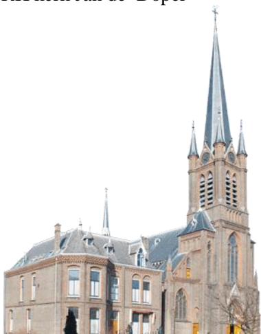
RK kerk Jan de Doper